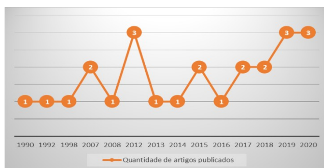
GRÁFICO 1 - Publicações por ano

Das vinte e quatro publicações examinadas, três eram da década de 1990 (uma em 1990, uma em 1992 e uma em 1998); três na década de 2000 (uma em 2007 e duas em 2008); e dezoito da década de 2010 (três em 2012; uma em 2013; uma em 2014; duas em 2015; uma em 2016; dois em 2017; três em 2018; em 2019 e em 2020), conforme o gráfico abaixo (Gráfico 1):