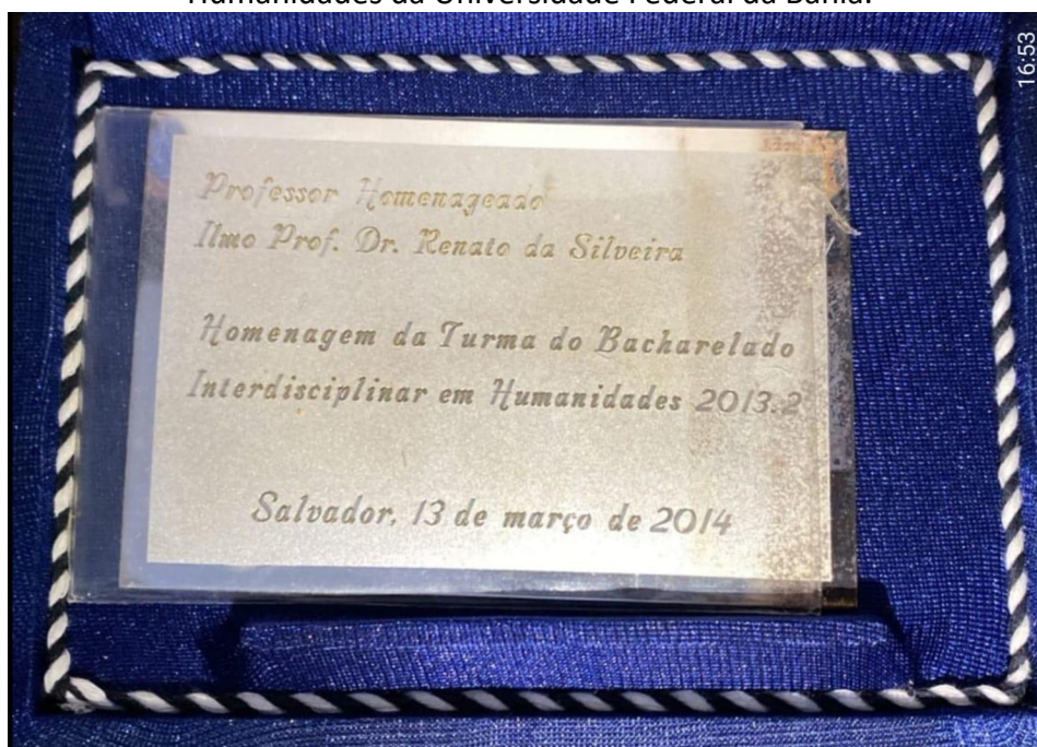
Figura 6 - Placa de homenagem oferecida pelos concluintes do Bacharelado Interdisciplinar em Humanidades da Universidade Federal da Bahia.