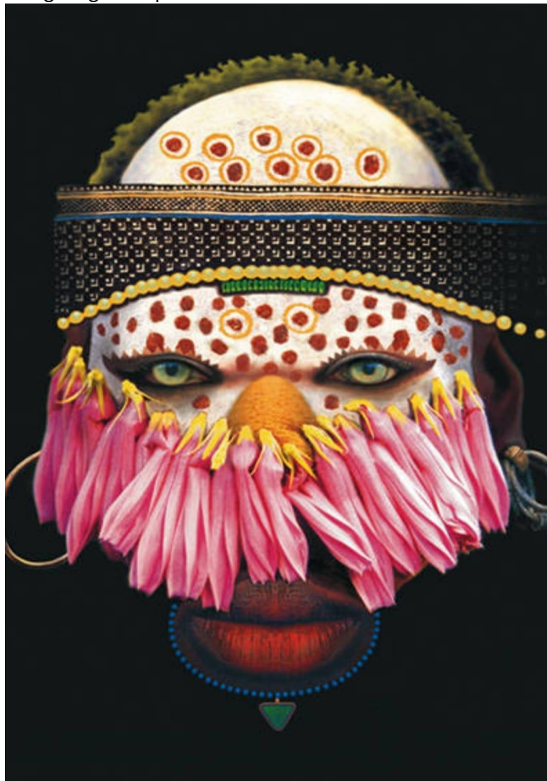
Figura 5 - Imagem gráfica publicada no Álbum Máscaras Afro-Brasileiras (2010)