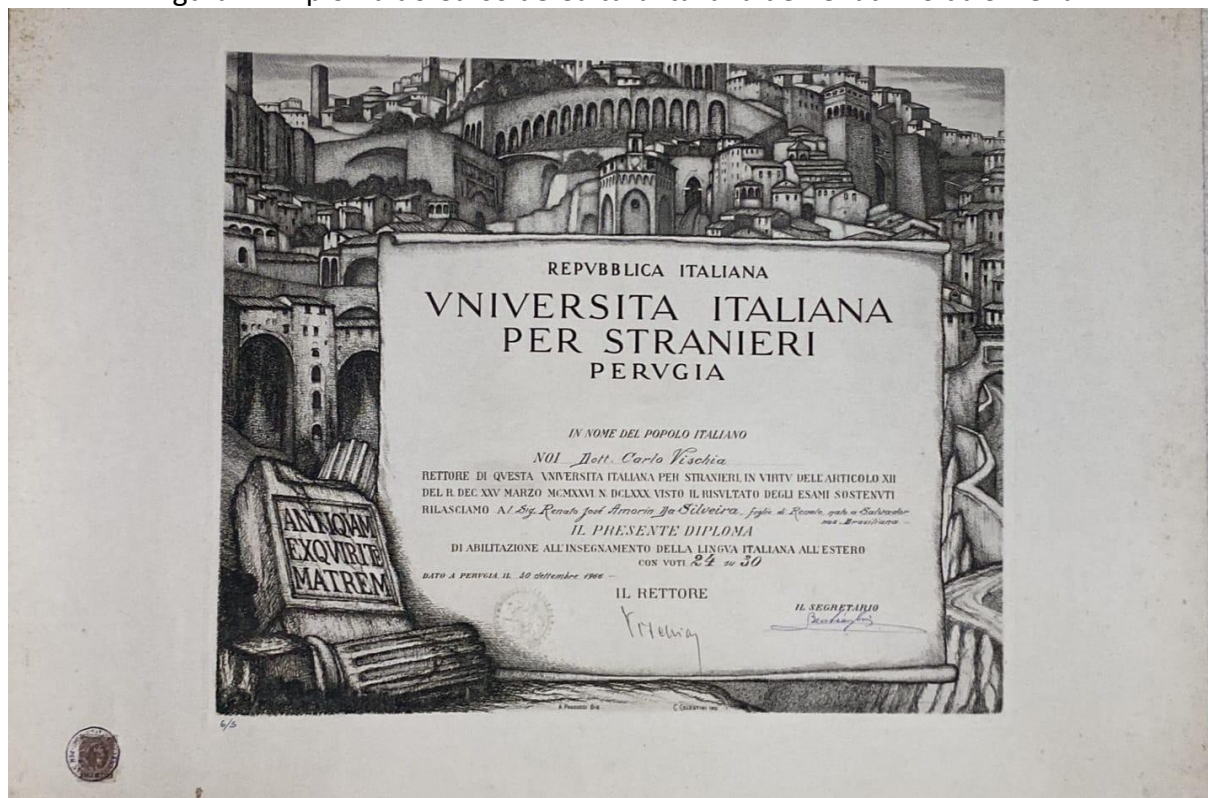
Figura 2 - Diploma do Curso de Cultura Italiana de Renatinho da Silveira